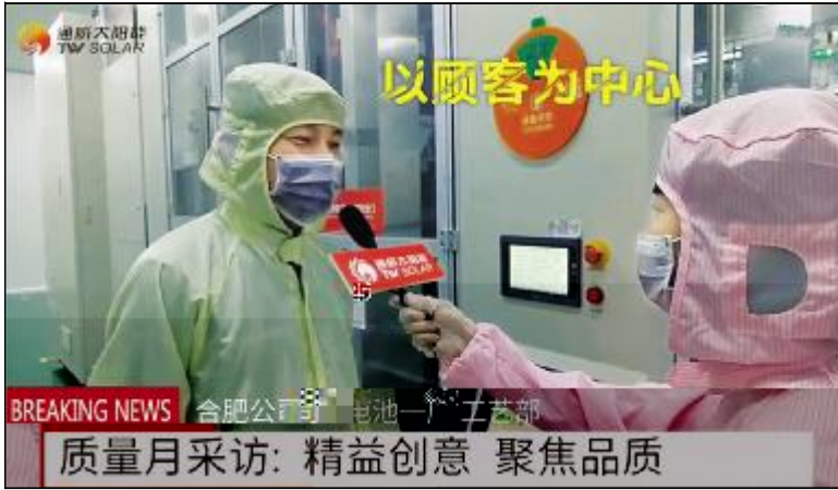
通威太阳能(合肥)有限公司举办“精益创意、聚焦品质”采访活动