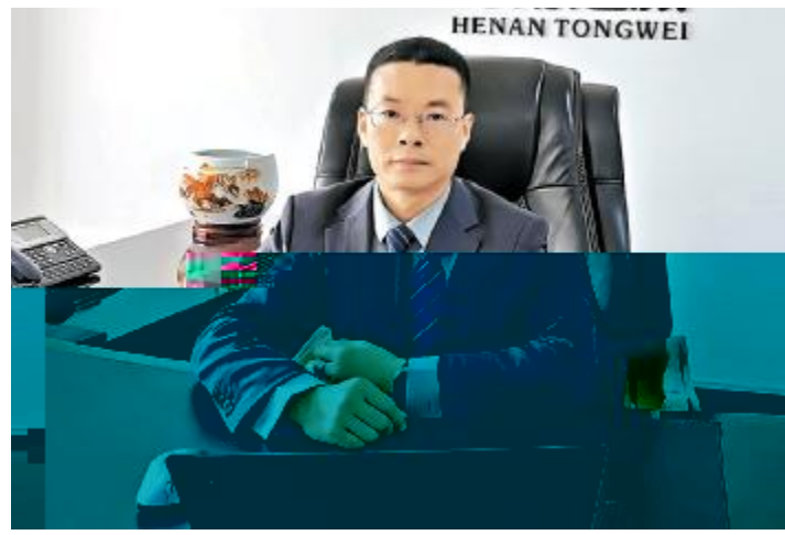
%- 23456789, %- 678: ; 2

养殖户$e的好产'。” df在ghi%的jk声l,在余仕华总经理$e,却是mngo。dp为hq,r表率dfstE不uvw着河南通威xy员工,不uz{河南通威|}~。通!一O"#$,河南通威%通!&4'() * +, 户17- , . 一/O(量12。河南通威3456(用好)*, 7T好7方, 89上通威; 化<产! ,最4N[\养殖户$e的好产'。