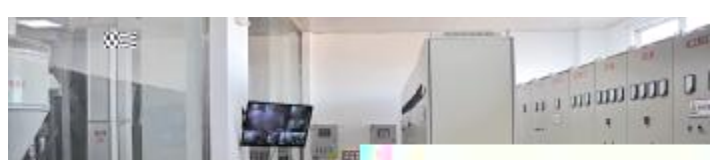
+, %- RSJTUVW

一9{i,通威]^“诚,l ,g,一”的经'理s,{诚7h,i 。=通!“-量方y": ; 化建j , f k能工 ,mn o产' p 化<产, ZUO1W。2022 S,提 \ ) * +, , - 量。一”的l s和qr。^,s" tO{-量为u,用户为O的' (vw,通!大量&4讲和养殖P x, 化yz{| ,} Z养殖1W^~,真gr &养殖WX最大化,G养殖户里" 9 #。2S,是通威“好产'S”,通威hE 6 "站在$养殖户 %发&的'O,为34提供通威好产',C领业()、*A发&。通威x面+Y发&, - Oq.发&方向,为“Dy/+”和“产'-量'O1是业发&的&2Z, = -3K4-量方y,) * : ; 化建j r。为业率qE是5- N: ; 化f的企业,通威通!专业化: ; 化,p 化aK?_产'的6和7fx! ,为养殖户提供+, =W的产'。! f j S,5, tO-量方y%N8 NW,通威_a, $r好产',向9大养殖户: a^~通威*,不; * < => * , =: 真含量, = ^ ~ , = Px , = ? @AXHB。