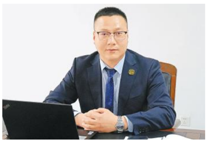
+, %- @/ABCD678EFG

一9{i,通威]^“诚,l ,g,一”的经'理s,{诚7h,i 。=通!“-量方y": ; 化建j , f k能工 ,mn o产' p 化<产, ZUO1W。2022 S,提 \ ) * +, , - 量。一”的l s和qr。^,s" tO{-量为u,用户为O的' (vw,通!大量&4讲和养殖P x, 化yz{| ,} Z养殖1W^~,真gr &养殖WX最大化,G养殖户里" 9 #。2S,是通威“好产'S”,通威hE 6 "站在$养殖户 %发&的'O,为34提供通威好产',C领业()、*A发&。通威x面+Y发&, - Oq.发&方向,为“Dy/+”和“产'-量'O1是业发&的&2Z, = -3K4-量方y,) * : ; 化建j r。为业率qE是5- N: ; 化f的企业,通威通!专业化: ; 化,p 化aK?_产'的6和7fx! ,为养殖户提供+, =W的产'。! f j S,5, tO-量方y%N8 NW,通威_a, $r好产',向9大养殖户: a^~通威*,不; * < => * , =: 真含量, = ^ ~ , = Px , = ? @AXHB。