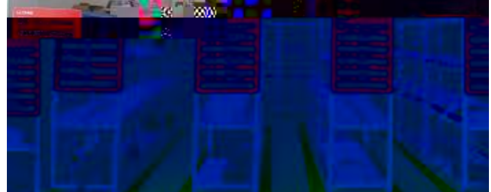
+, %- HI JKLMN